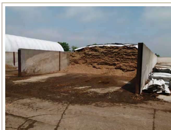
Un toit ou un couvercle réduit les pertes d'éléments nutritifs par les effluents.