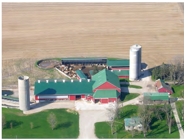
La réfection du revêtement des murs du silo contribue à empêcher l'écoulement des effluents et à maintenir le bon état de la structure du silo.