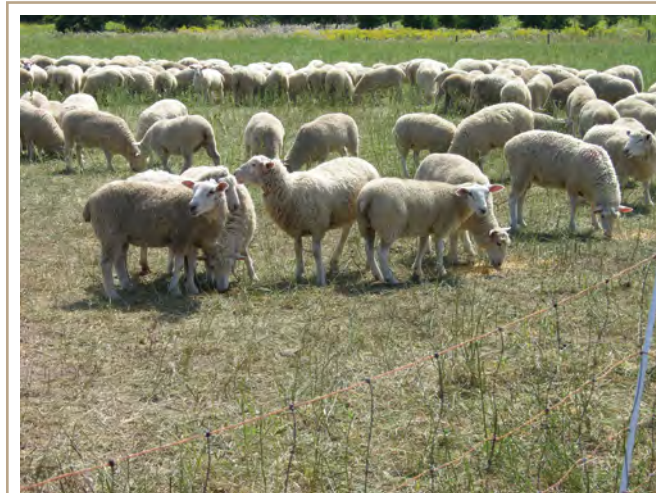
L'alimentation du bétail mise au point dans le cadre de groupes de gestion peut améliorer l'indice de consommation.