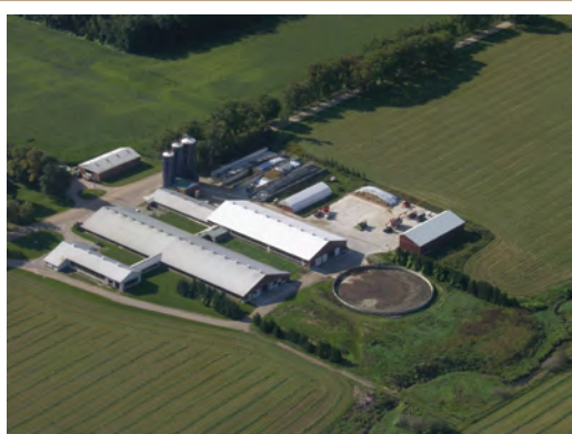
Maximiser la distance entre le silo et les sources d'eau de surface afin de réduire au minimum les risques pour la qualité de l'eau de surface.

Pour un aperçu du processus de circulation de l'eau dans une exploitation agricole et en aval de cette dernière ainsi que de l'information sur les risques à la ferme en matière de qualité de l'eau et les méthodes pratiques pour protéger l'eau, voir le fascicule PGO sur le sujet.