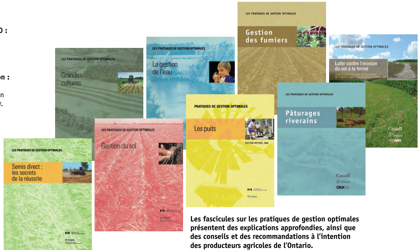
Les fascicules sur les pratiques de gestion optimales présentent des explications approfondies, ainsi que des conseils et des recommandations à l'intention des producteurs agricoles de l'Ontario.