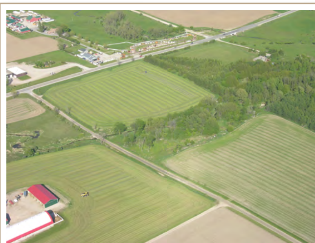
Le moment de la récolte et les précipitations sont d'importants facteurs qui influent sur la qualité de l'ensilage.