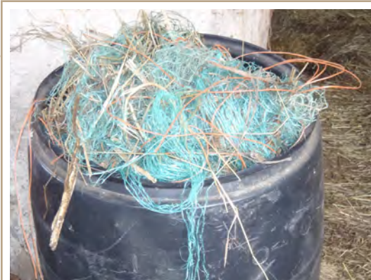
Le matériel qui ne peut être réutilisé ou recyclé doit être éliminé dans un lieu d'enfouissement approuvé.

Pour connaître les ressources locales en recyclage, voir les pages jaunes et bleues de votre annuaire de téléphone, aux rubriques « déchets » et « recyclage ».