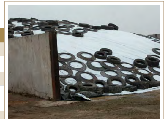
Les vieux pneus peuvent être réutilisés à d'autres fins à la ferme, par exemple pour retenir des bâches de protection.

Pour de plus amples renseignements, communiquer avec Ontario Tire Stewardship, au 1 888 687-2202 ou à l'adresse www.rethinktires.ca .