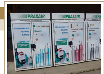
De nombreux détaillants acceptent les contenants à remplissages multiples si des produits de remplacement sont achetés.