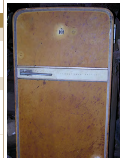
Les vieux appareils ménagers peuvent représenter un risque d'accident et un danger pour l'environnement.