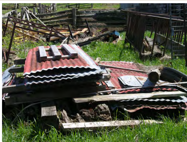
La plupart des composantes de bâtiments non contaminées peuvent être recyclées ou réutilisées.