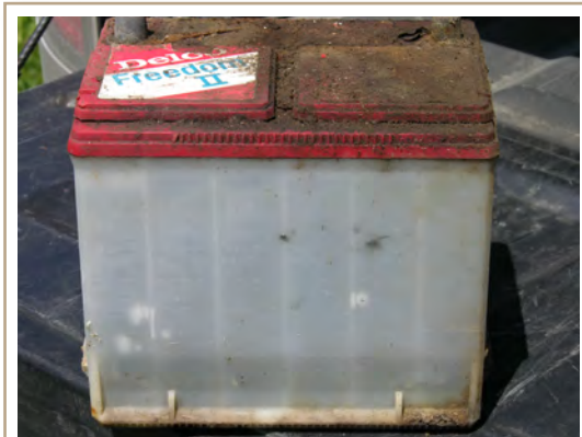
Un rabais correspondant à la valeur de reprise est en général consenti lorsque vous achetez une batterie de remplacement neuve.

Pour en savoir davantage sur le recyclage :