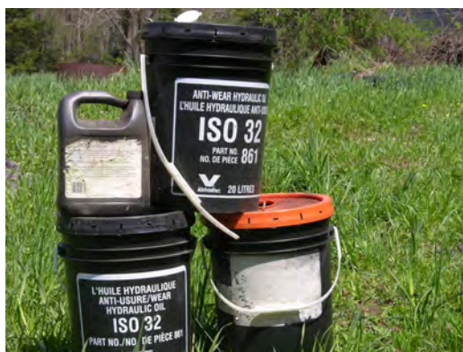
En gros, 50 % du milliard de litres d'huiles lubrifiantes vendus chaque année au Canada peuvent être réutilisés.