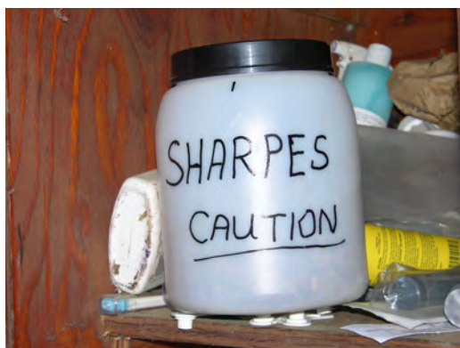
Ranger le matériel de santé animale usagé dans un contenant fermé, rigide et étanche. Ne pas utiliser de contenants de verre.