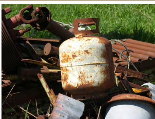
Ne mettez pas de contenants sous pression (p. ex., des bonbonnes de propane) dans les chargements de ferraille.