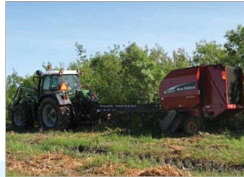
La biomasse de courte rotation peut être récoltée pour la production d'énergie.