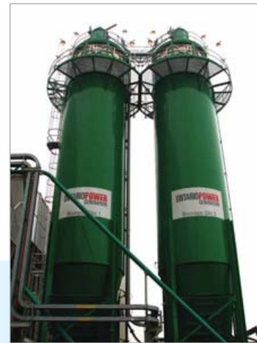
La biomasse ligneuse peut alimenter de grandes centrales électriques qui en tirent l'énergie par combustion.