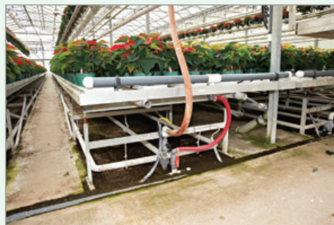
Récupérez et réutilisez si possible les eaux de percolation issues des solutions nutritives appliquées par aspersion.