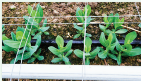
Ayez une bonne connaissance des propriétés du type de sol utilisé et vérifiez régulièrement la CÉ et le pH des planches de culture.

Si la culture est produite dans le sol, analyser et stériliser le sol entre les cycles de production. Vérifier la CÉ et modifier le pH et les apports d'éléments nutritifs au besoin.