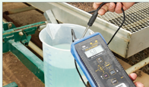
Une analyse régulière de la CÉ et du pH de l'eau d'irrigation et des substrats de culture permet de prévenir les problèmes de carences nutritionnelles.