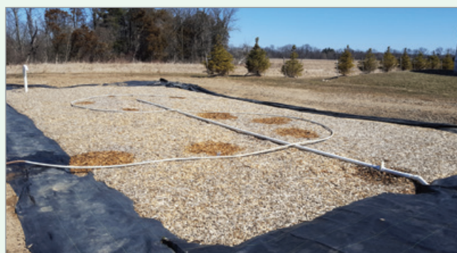
Une bande de végétation filtrante (à gauche) et un bioréacteur à copeaux de bois (à droite) sont des méthodes qui peuvent être utilisées pour traiter les eaux usées.