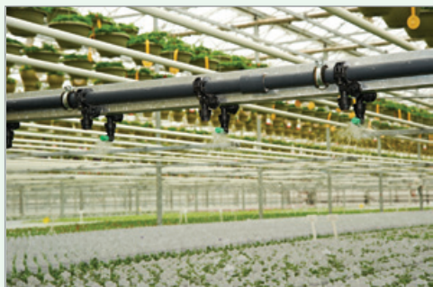
Dans un système d'irrigation en circuit fermé, l'eau d'irrigation appliquée par aspersion est récupérée.

Se tenir au courant des recherches récentes en matière de fertilisation. Certaines nouvelles formulations peuvent présenter des avantages, comme les éléments nutritifs à libération programmée qui favorisent la réduction des teneurs en éléments nutritifs dans l'ensemble des eaux de percolation.