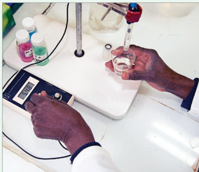
Le fait de connaître la qualité de l'eau permet de repérer des risques potentiels et de prendre les mesures pour les gérer.