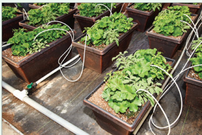
Les systèmes goutte à goutte de faible débit à compensation de pression utilisent moins d'eau et empêchent les pertes d'eau entre les contenants.