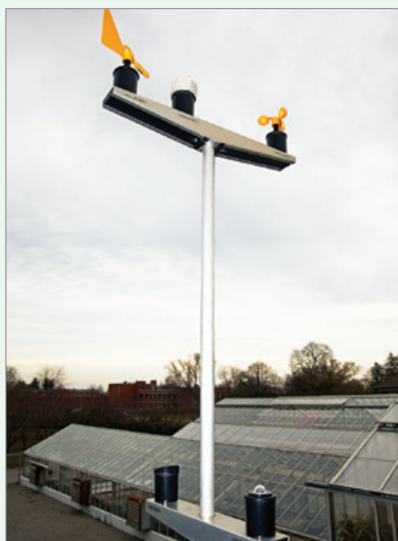
Les conditions de la serre, le climat ambiant (comme les niveaux d'éclairage et la température) ainsi que les besoins de la culture devraient être pris en compte dans l'établissement de l'horaire des arrosages.

Consulter aussi les fascicules de PGO intitulés La gestion de l'eau et Gestion de l'irrigation .