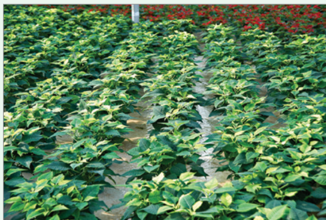
Les systèmes de subirrigation permettent de récupérer l'eau et les éléments nutritifs en production serricole, uniquement si l'eau est recueillie, stockée et réutilisée.

B.8 Si vous utilisez un système de subirrigation, quel pourcentage de l'aire de production pourvue de ce système est en circuit fermé? Dans un système en circuit fermé, l'eau d'irrigation est recueillie, stockée et réutilisée pour arrosage ultérieur.